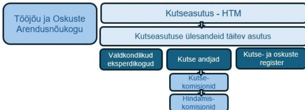
Joonis 3. Kutseüsteemi osalised vastavalt kutse- ja oskuste seaduse eelnõule.

Eelnõuga vähendatakse kutseüsteemi osaliste arvu ning täpsustakse nende ülesanded, et suurendada selgust, mh haldusotsuste vastuvõtmisel.