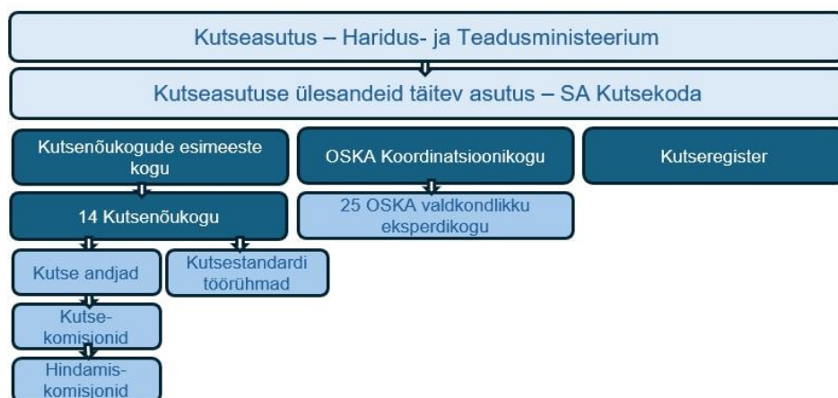
Joonis 2. Kutsesüsteemi osalised vastavalt kehtivale kutseseadusele

Eelnõu peatükis 2 kirjeldatakse kutsesüsteemi osalisi ning nende ülesandeid. Võrreldes varasema kutseseadusega on kutsesüsteemi osaliste ring ning nende ülesanded märkimisväärselt muutunud. Senise kutsesüsteemi probleem on erinevate kogude paljusus ning neile erinevate regulatsioonidega antud ülesannete mitmekesisus, mis muudab kutsesüsteemi ebaefektiivseks ja protsessid ajamahukaks.