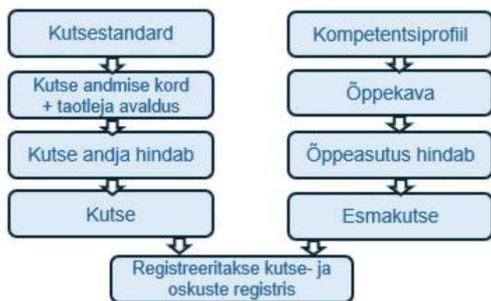
Joonis 5. Kutse andmise ja esmakutse andmise üldpõhimõte.

Esmakutse andmise õigusega lahendatakse ka tänases süsteemis tekkinud ebakõla, kus tulenevalt sellest, kas õppeasutus oli taotlenud kutse andmise õigust või mitte, oli õpitulemuste hindamine ning õppe lõpus saadav kutse taotleja jaoks kutse andjast tulenevalt erinev. Sellega tekkis olukord, kus sama kutseala tasemeõppe lõpus peavad osade õppeasutuste õpilased sooritama konkursiga valitud kutse andja juures eksami ning teised, kelle õppeasutus on kutse andja, läbivad hindamise õppeasutuses. Tulenevalt sellest võisid õpilased saada ka erineva kehtivusajaga kutse. Antud probleemile on juhtinud tähelepanu ka õiguskantsler viidates, et kutse kehtivusaja sõltuvus kutse andjast seab õpilased ebavõrdsesse olukorda ning riivab nende põhiõigusi juhul, kui kutse annab ligipääsu tööturule. Muudatusega saavad kõik õppeasutused, mille õppekava vastavuse on kinnitanud Haridus- ja Teadusministeeriumi õppekavade komisjon, automaatselt esmakutse andjaks.